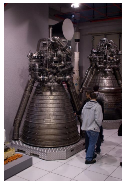
VISITE DE LA SNECMA VERNON

Des stages en entreprises sont obligatoires pour les étudiants afin de leur permettre d'appréhender de manière concrète les exigences et les réalités du monde du travail, les enjeux stratégiques de l'industrie et les besoins des entreprises. Sur l'ensemble du cursus, 12 mois minimum sont dédiés à la formation en entreprise.